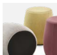
Anti-Rutsch-Gewebe an der Unterseite